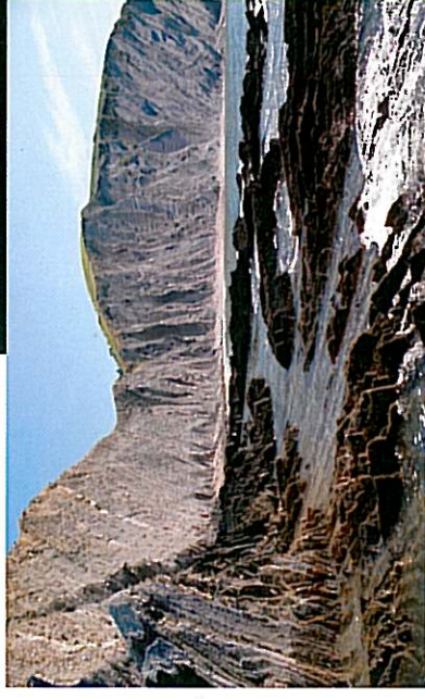
Hondariza, Sakoeta Punta eta itsasbeherarekin ikus daitezkeen marearteko zabalgunea

Zumaia labarrek "flysch" izen teknikoa hartzen dute. Geruzen sekuentziak dira, milorri izugarri baten moduan, non material gogorreko geruzak (kalizak eta hareharriak) material bigunekoekin (tuparriak eta harri buztintsuak) tarte-katzen diren. Kretazeoan zeharreko lur-mugimenduek jatorriari horizontalak ziren geruza horiek antolamendu bertikala hartzea eragin zuten. "Flysch" aren orriak itsasoan sartzen dira interes geologikoa izateaz gain oso ederra den sailheskia bezala.